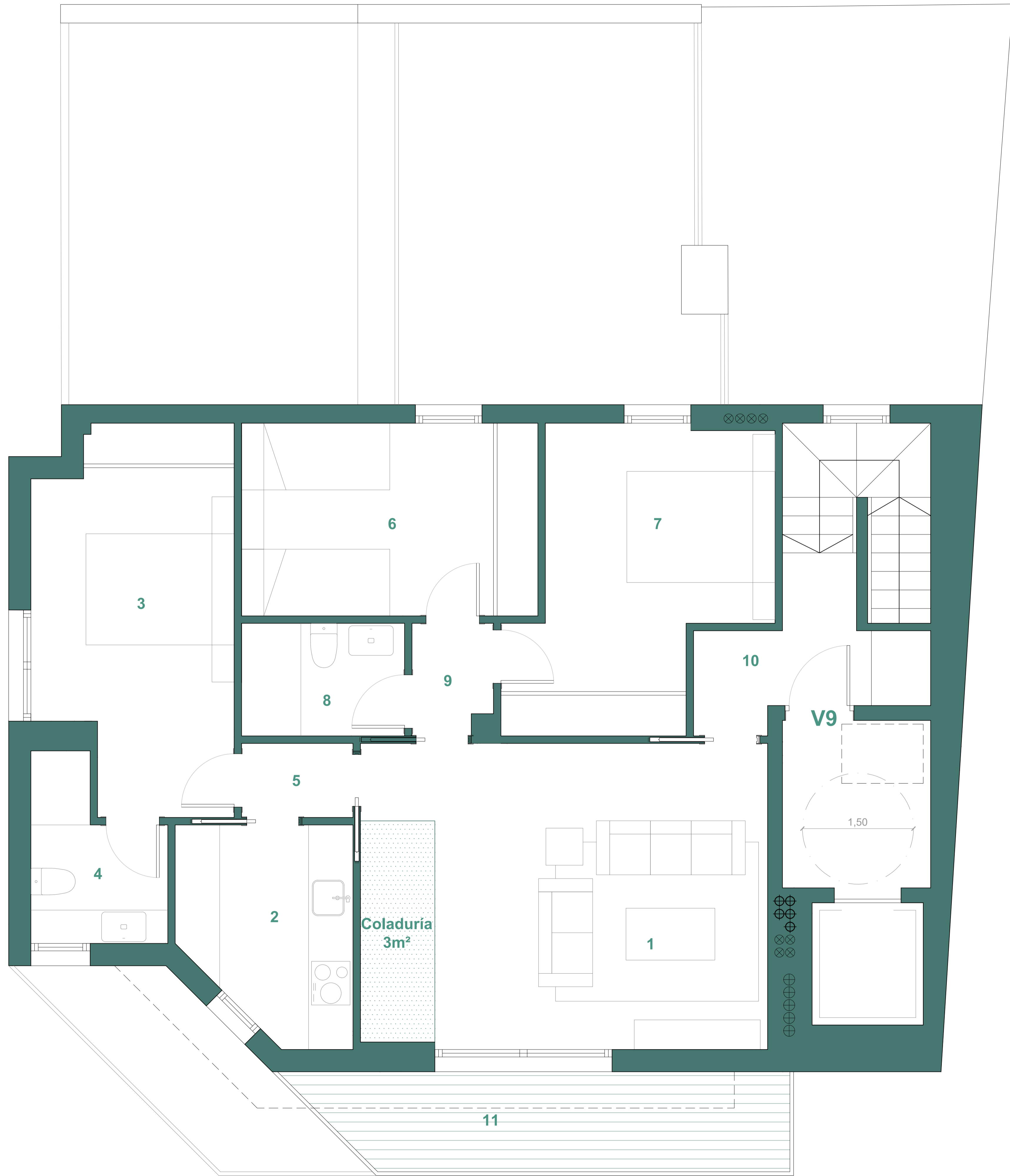
SUPERFICIES PLANTA QUINTA (m²)