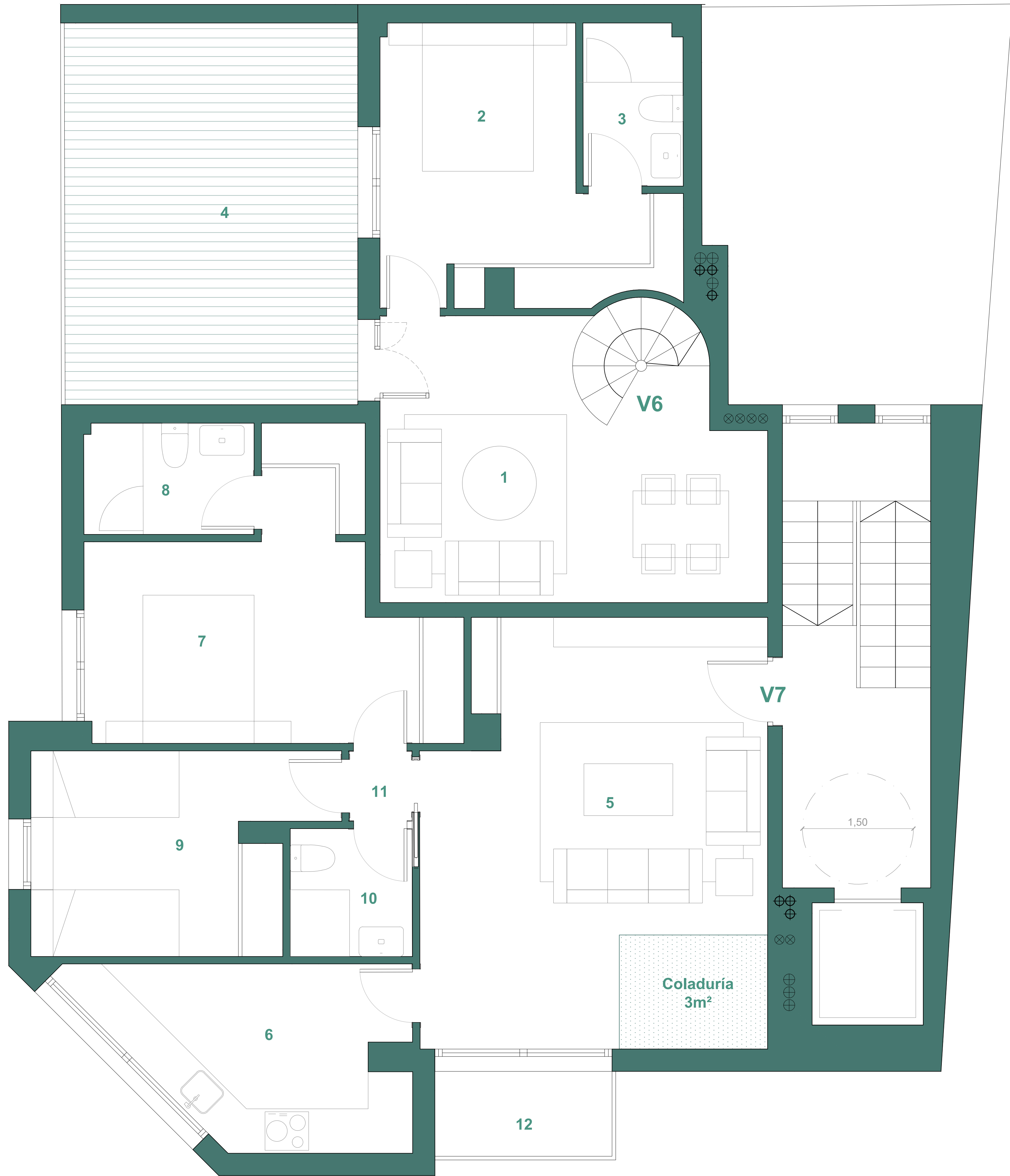
SUPERFICIES PLANTA TERCERA (m 2 )