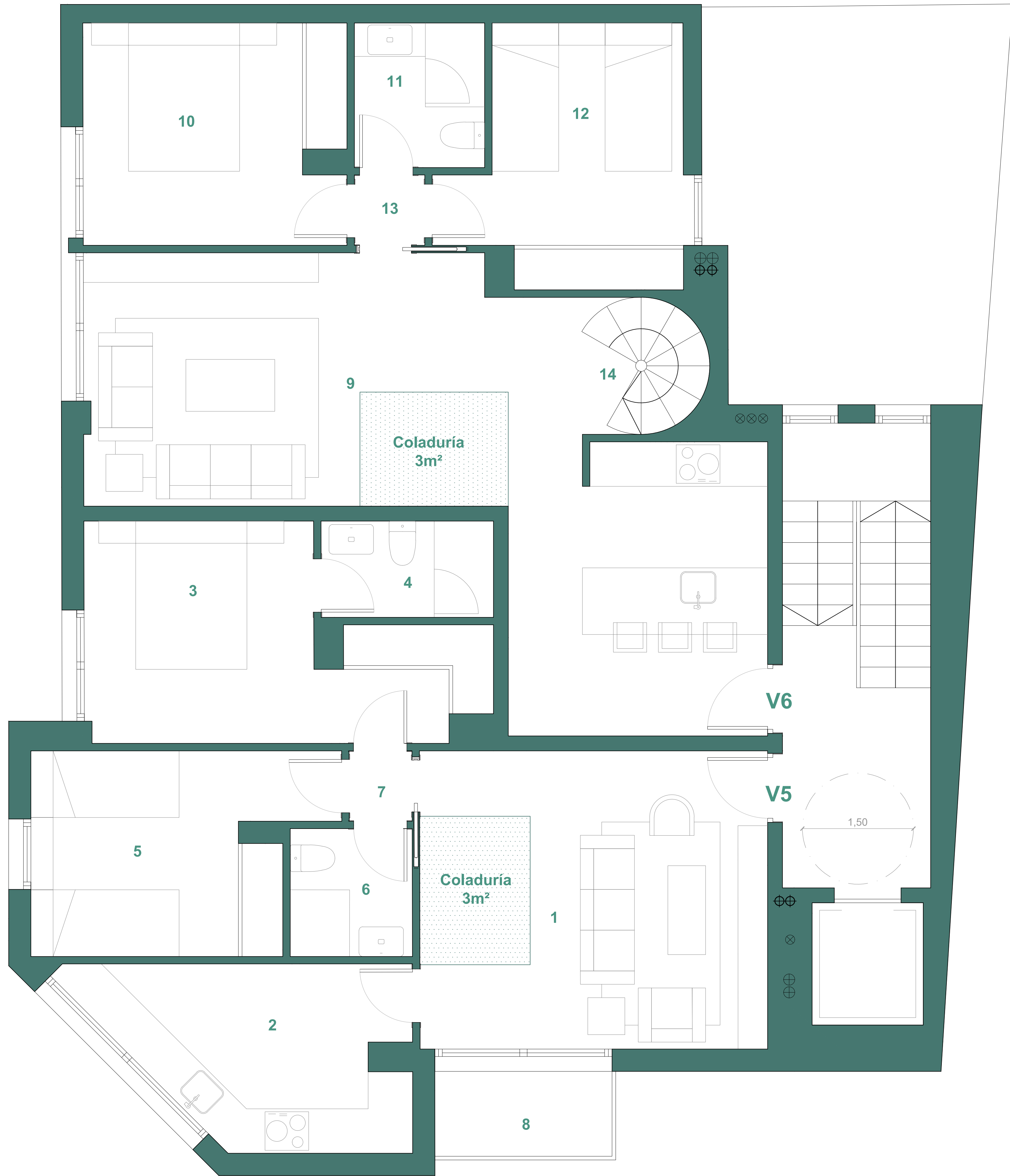
SUPERFICIES PLANTA SEGUNDA (m²)