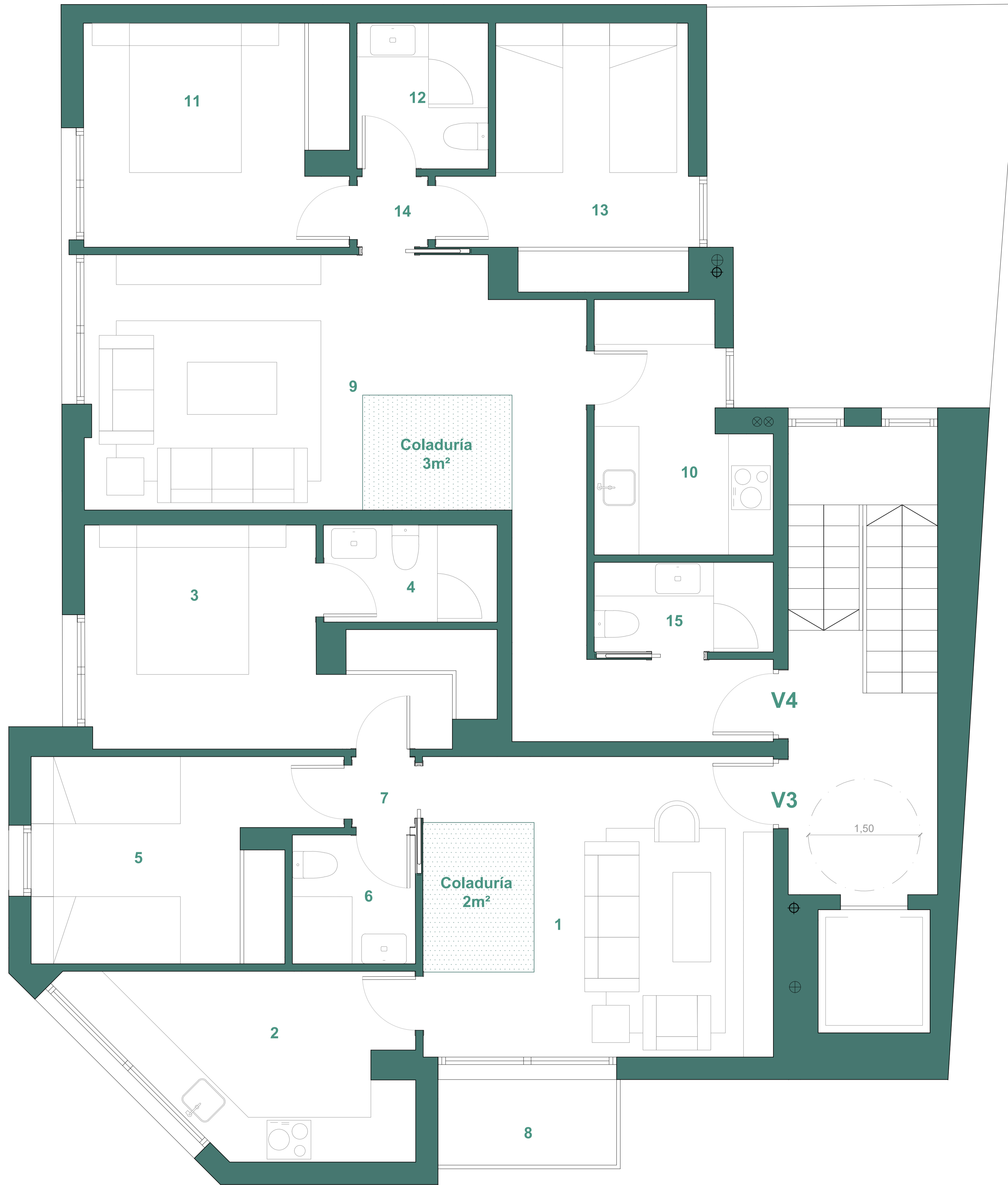
SUPERFICIES PLANTA PRIMERA (m²)